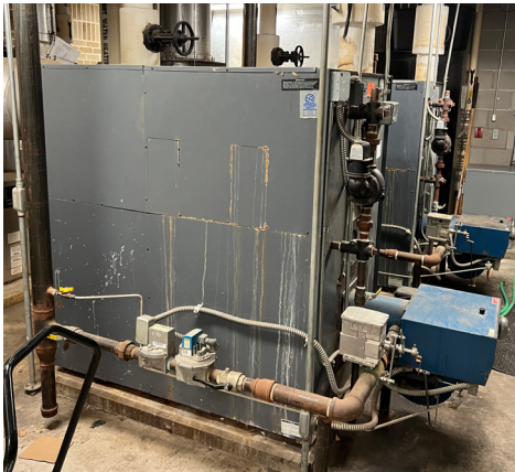
Calderas en BPS han llegado al final de su utilidad y requieren reparamiento frecuentemente.